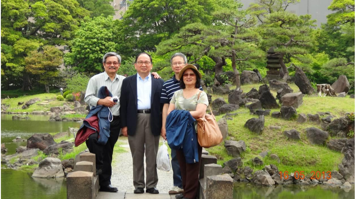
cối cuối cùng thì anh Vĩnh Trường cũng gặp được chúng tôi