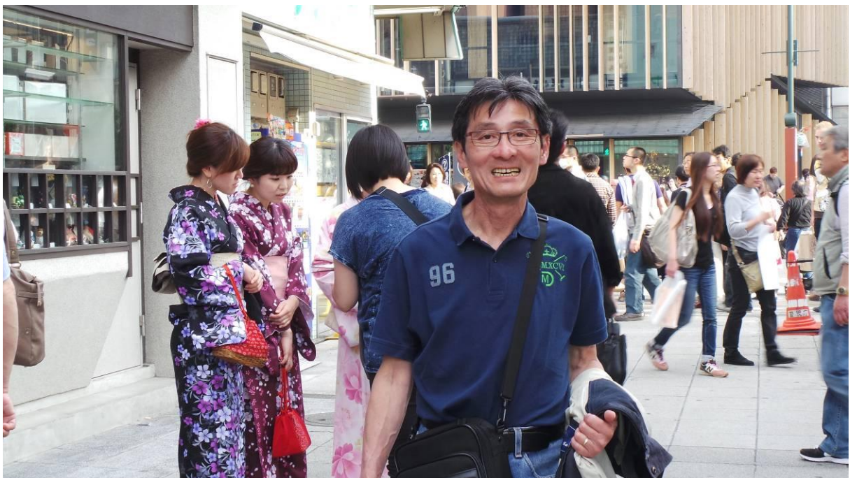
tiệm ăn của Vĩnh Trường ở ga yoyogi