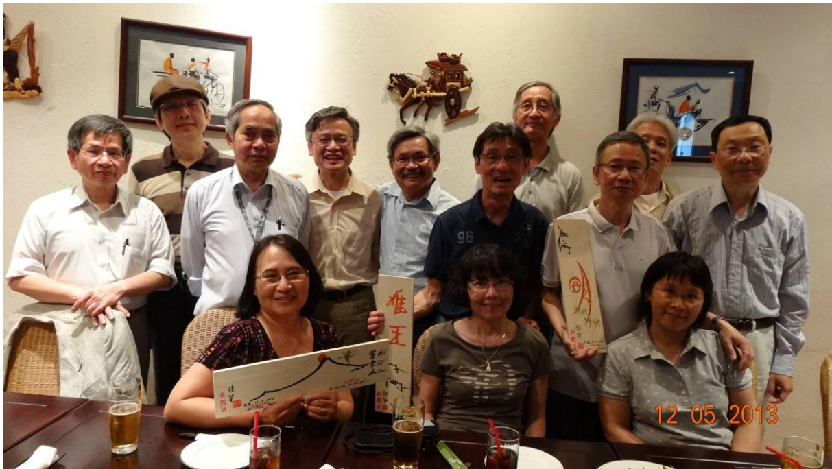
dô 1 cái cho mát