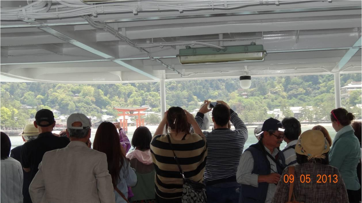
sang tới đảo