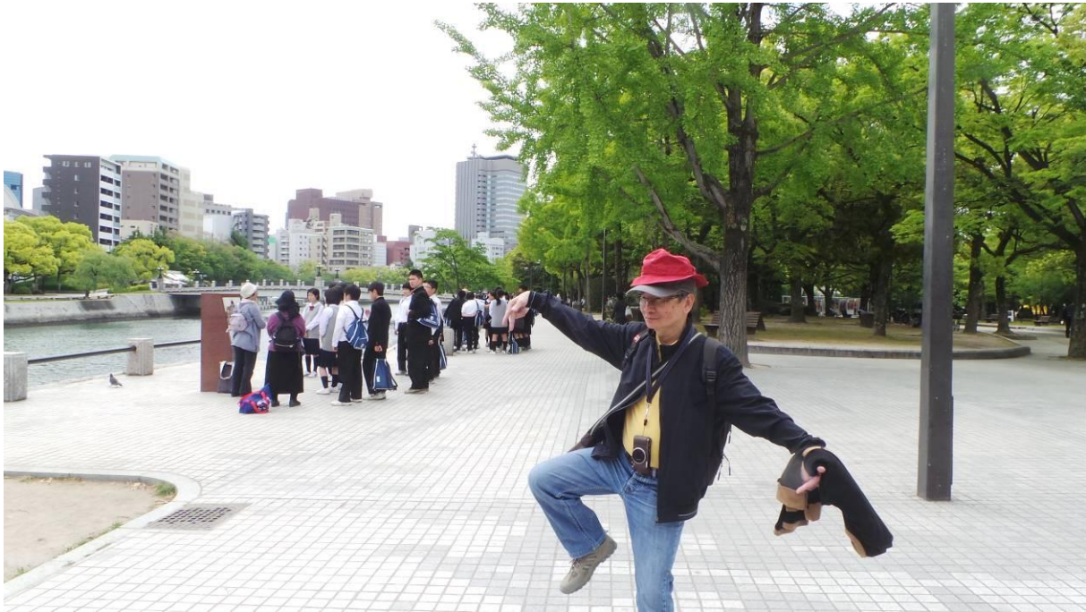
sửa soạn lấy tàu thủy đi sang Miyajima