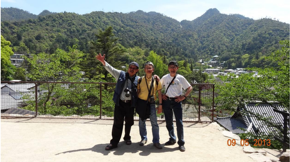
dạo 1 vòng trước khi về