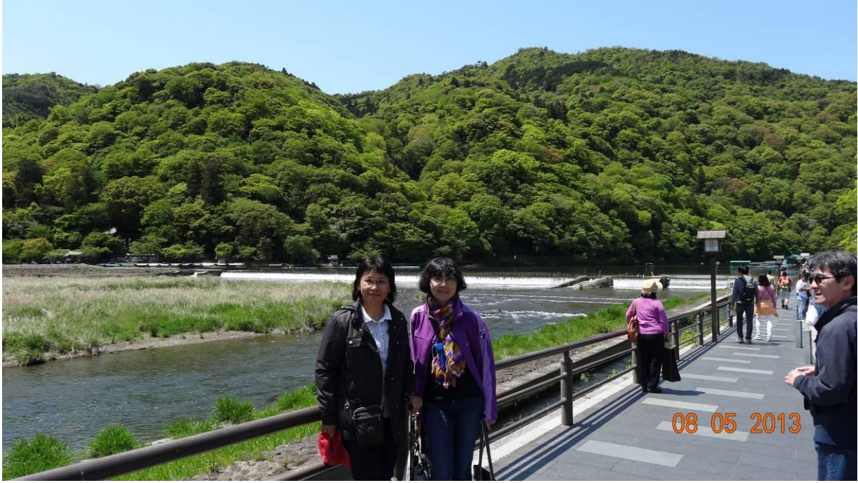
cho ôm chút xíu