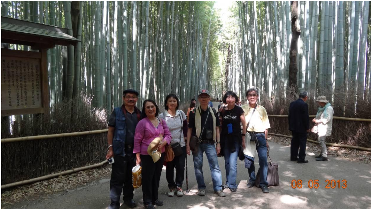
rất tiếc hôm đó không đi 'romantic train sagano' vì đóng cửa