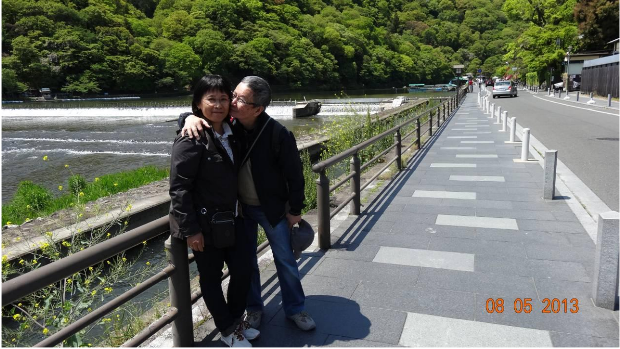
muốn bắt chước quá mà mắt cở