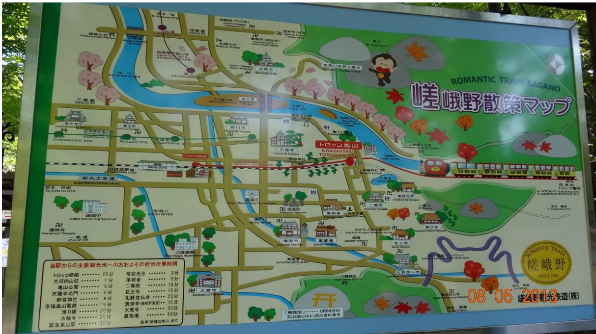
trên đường đi bộ về nhà ga