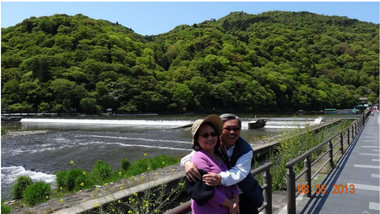
không những ôm mà còn 'hun' 1 cái