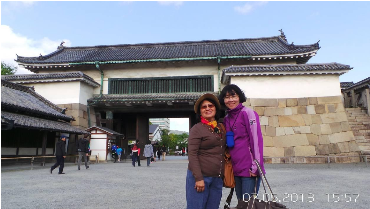
bên trong thành