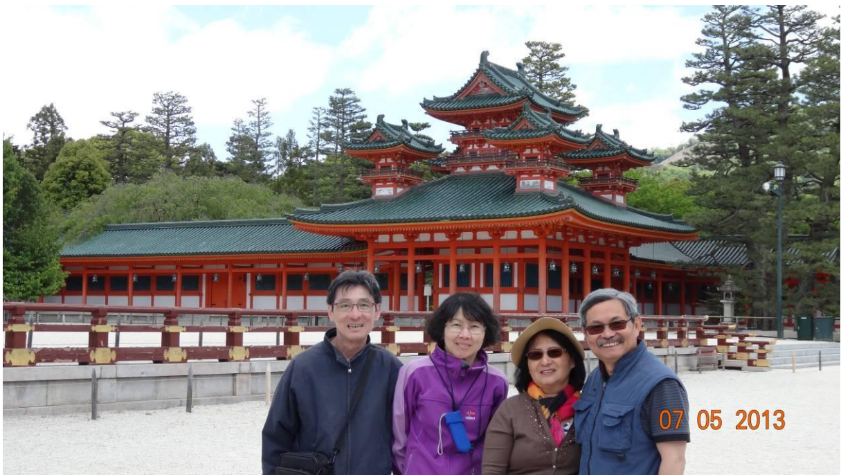
trông công viên