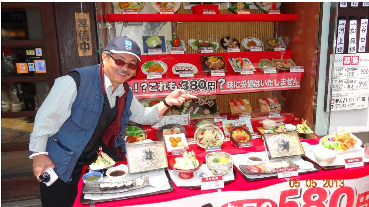
phố tàu (con đường bán đồ ăn) nằm kế bên thương xá của nhật bản