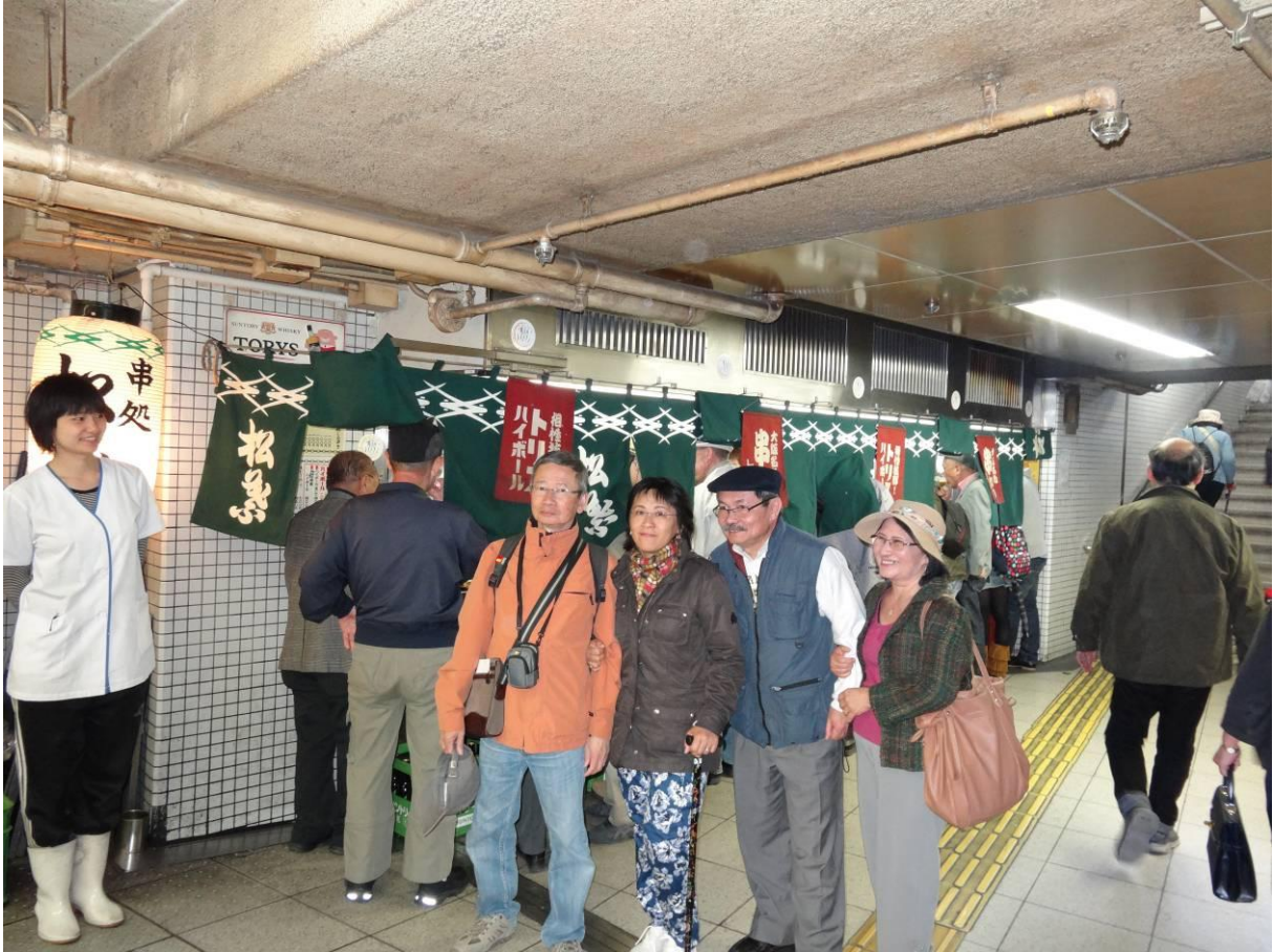
nhà ga Osaka