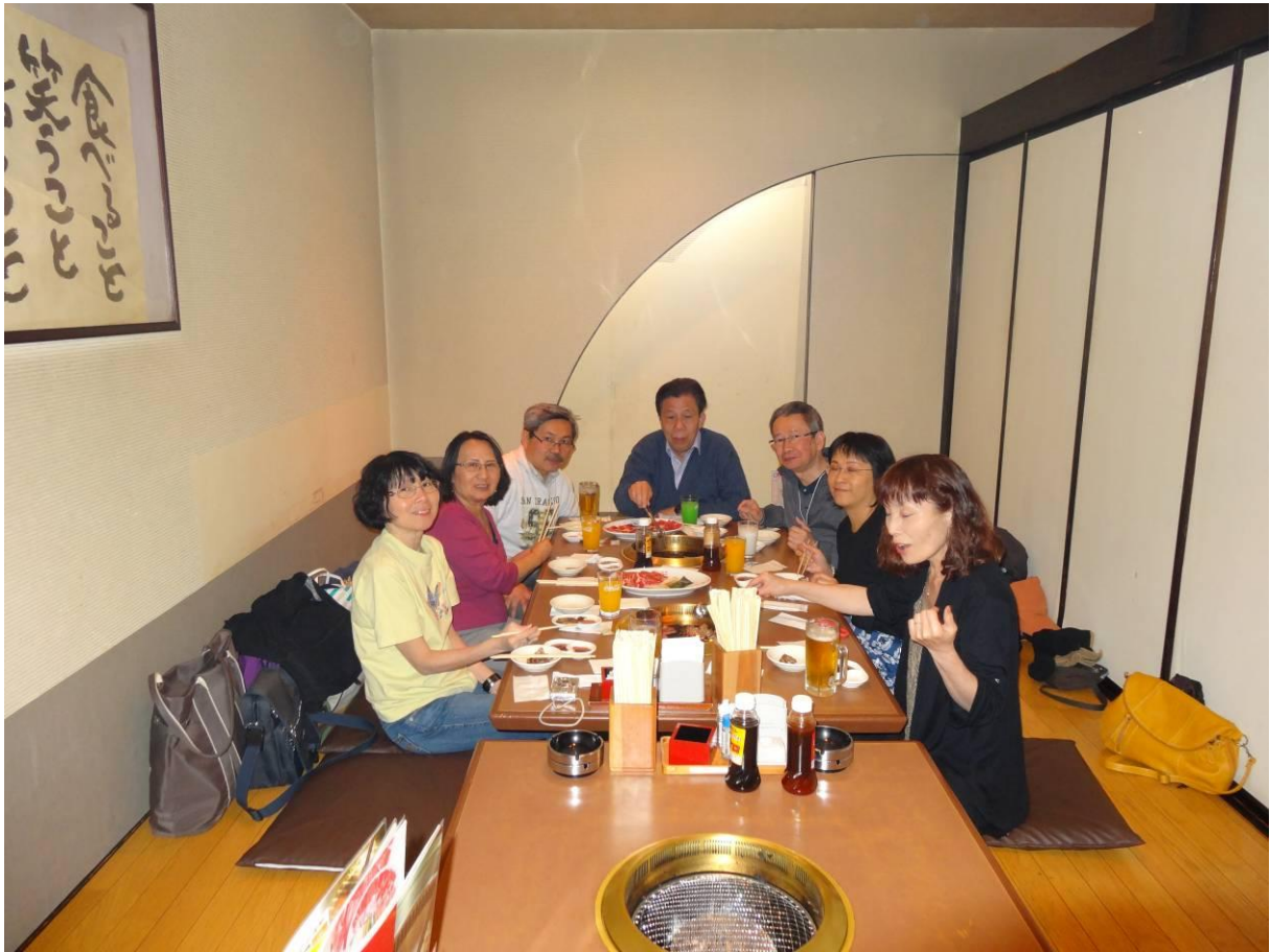
trước khi chia tay