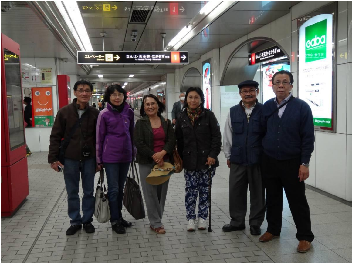
ăn ramen ,soba , udon đứng trong ga xe điện