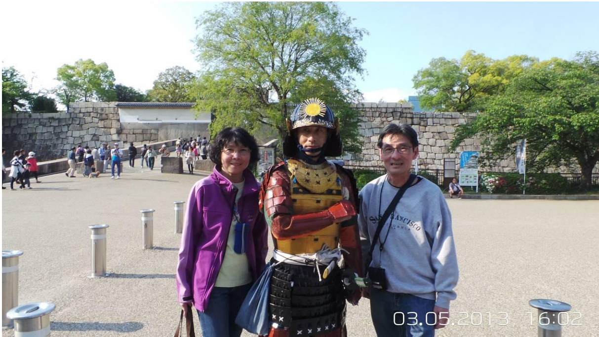
ăn trưa ở Osaka