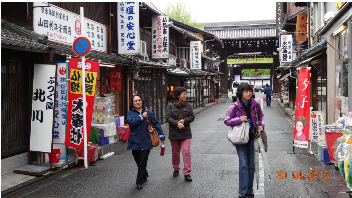
trên đường đi đến kyoto aquarium