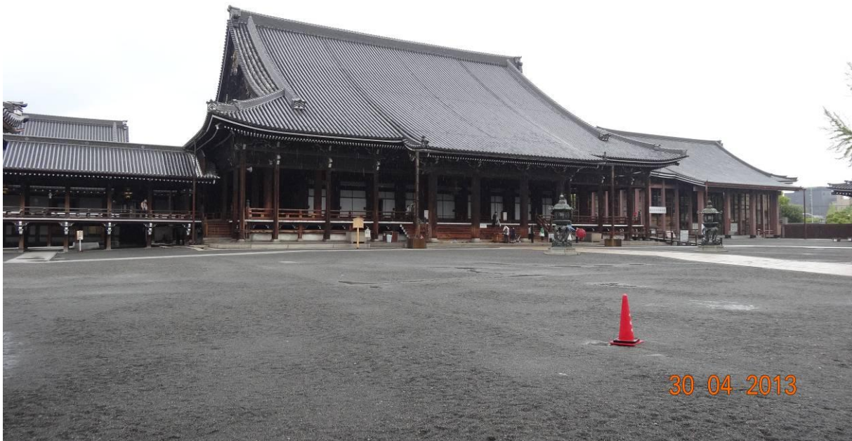
mặt ngoài của Nishi honganji