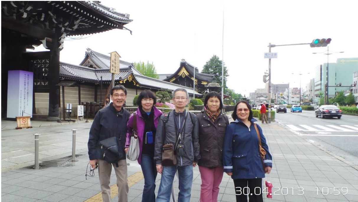
sau khi đi nishi honganji , đi dạo 1 vòng gần ryokan